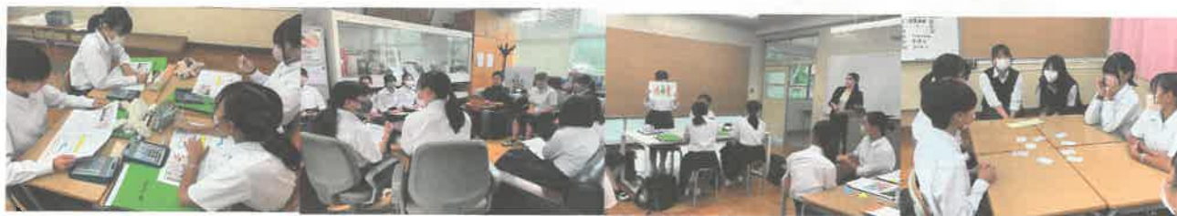
【福岡女子商業高校】

普通科の高校では体験できないサロンやマーケティングなどのことをたくさんすることが出来て良い経験になりました。来年の進路選びにも生かしていきたいです。