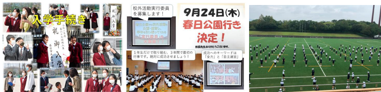
3/10 クラスマッチ大成功!